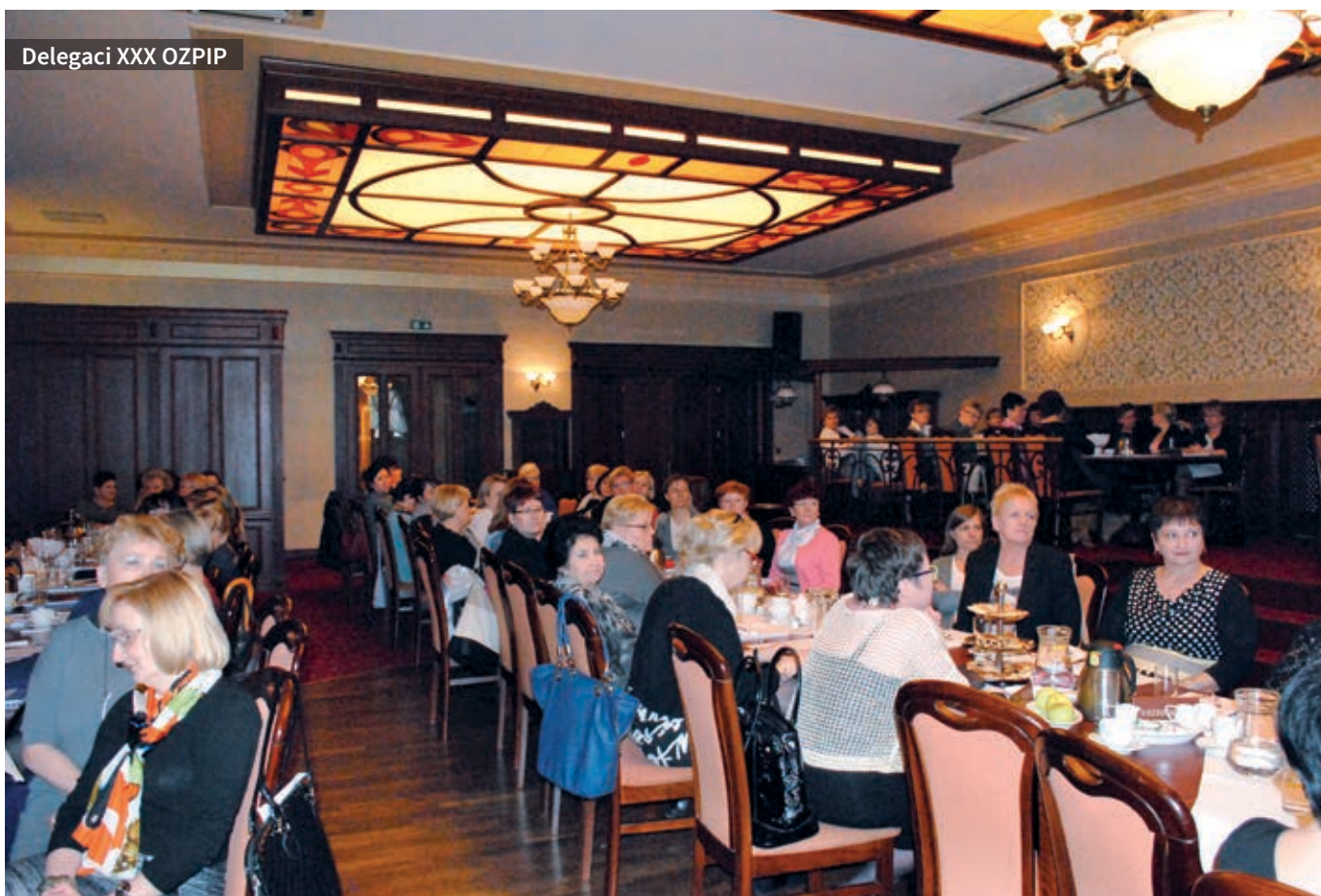
Delegaci XXX OZPIP

zakresem rodzinę i pacjenta, przygotowując do samoopieki i samopielęgnacji oraz kształtując umiejętność radzenia sobie z chorobą i niepełnosprawnością. Uwzględnia również wsparcie psychiczne rodziny na każdym etapie choroby członka rodziny oraz pomoc w pozyskaniu sprzętu medycznego i rehabilitacyjnego niezbędnego w sprawowaniu opieki.